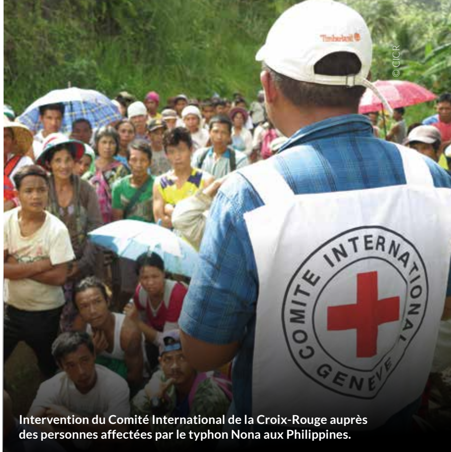
Intervention du Comité International de la Croix-Rouge auprès des personnes affectées par le typhon Nona aux Philippines.

Partout dans le monde, la Croix-Rouge apporte une aide concrète à ces personnes, sur leur lieu de vie ou sur le parcours migratoire de celles qui fuient. En Belgique, elle participe aussi à l'accueil des personnes qui demandent la protection de notre pays. Quelles que soient les raisons de leur migration, elles peuvent être accueillies et accompagnées dans l'un des 22 centres ouverts Croix-Rouge durant l'examen de leur demande de protection internationale.