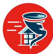
Catastrophes naturelles Sécheresse Inondations Incendies